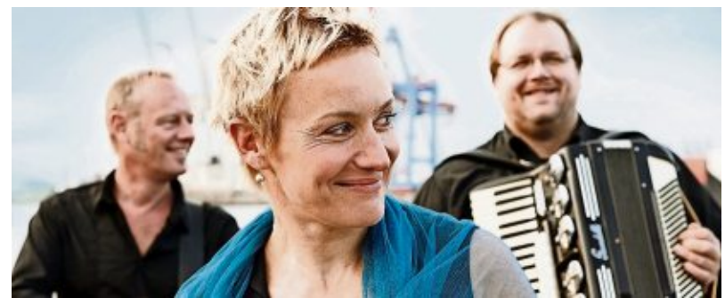
Unter dem Titel „Bei Westwind...“ gastiert das Trio „Hafennacht“ am Sonnabend im „Cultimo“ in Kuhstedtermoor.

Die Veranstaltung im „Cultimo“ beginnt um 20 Uhr, die Küche öffnet bereits um 19 Uhr, es werden themenbezogene Gerichte angeboten. Anmeldung: ☎ 047 63/628183 oder per E-Mail (events@cultimokuhstedtermoor.de) bis 24. November, 13 Uhr entgegenkommen. (bz)