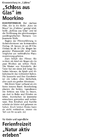
Kinoworstellung im „Cubimo“